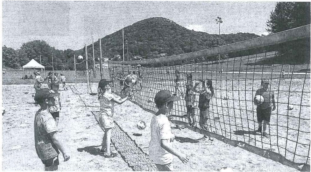
Sur le site de la Malcombe et surtout sous un soleil magnifique, les 300 élèves de primaire ont pu tester plein de sports comme ici le volley-ball. Tout ça sur le thème des Jeux Olympiques et de Paris 2024.

Ce mercredi sportif était donc aussi sur le thème de la candidature de Paris pour organiser les JO.