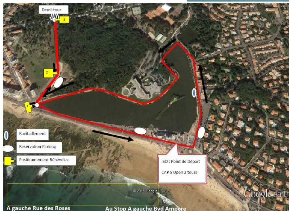
COURSE A PIED Triathlon S: 2 Boucles de 2.5 Kms