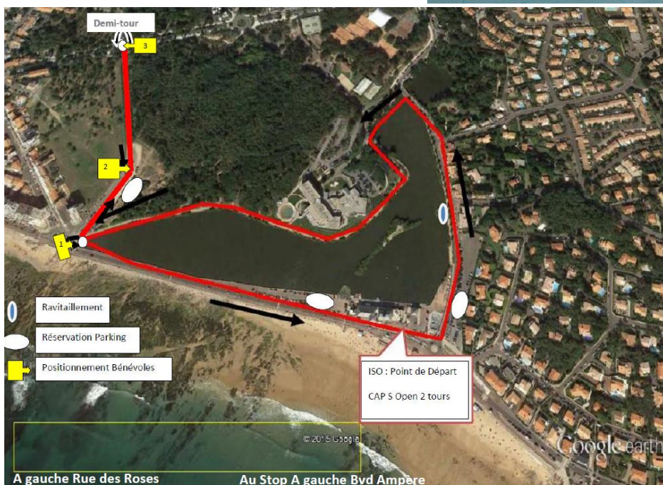
COURSE A PIED Triathlon S: 2 Boucles de 2.5 Kms