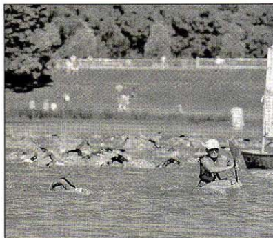
Le coup de starter vient d'être donné. Tous les concurrents sont partis pour au moins quatre heures d'effort